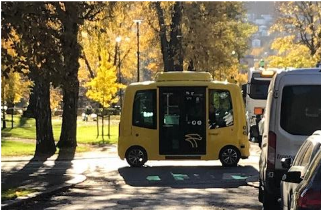
Fra høsten 2018 og frem til sommeren 2023 testet Brakar selvkjørende buss i Kongsberg og Drammen.

Høsten 2018 var Brakar først i verden med å lansere en selvkjørende buss fullintegret i kollektivtransporten. Pilotperioden i Kongsberg varte frem til desember 2021, og deretter overført til Drammen. Bussen gikk i fast rute mellom Drammen park og CC etablert som linje 1. Prøveprosjektet var et samarbeid mellom Brakar, Applied Autonomy, Vy og Drammen kommune, og ble finansiert av Brakar med støtte fra Buskerudbyen. Prosjektet i Drammen ble evaluert og avsluttet i juni 2023.