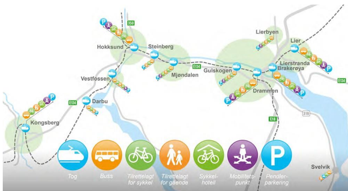
Figur 2 Det foreslås sterk satsing på knutepunktutvikling i forslag til byvekstavtale for Buskerudbyen.

Porteføljen består av en rekke mindre og mellomstore tiltak for grønn mobilitet, og er uten store kapasitetsøkende vegprosjekt. Det legges stor vekt på tiltak som utnytter ny teknologi og eksisterende infrastruktur på en mer effektiv måte, og som gjør det mer attraktivt å gå, sykle og reise kollektivt.