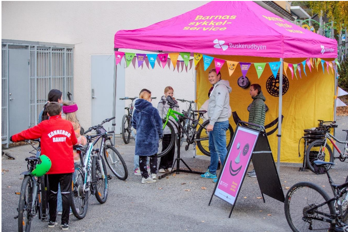
Gjennom Barnas sykkel-service har Buskerudbyen så langt reparert 1600 sykler gratis mens barna er på skolen.

motivasjonsforedrag og mindre økonomiske bidrag til fysisk tilrettelegging som sykkelparkering, garderobe eller lignende.