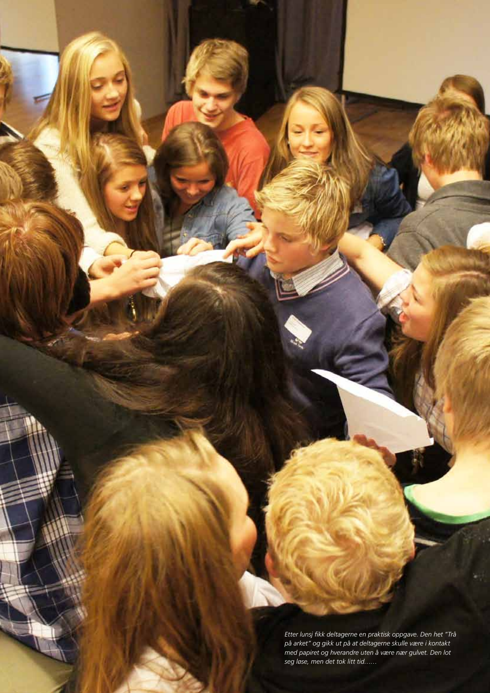
Etter lunsj fikk deltagerne en praktisk oppgave. Den het "Trå på arket" og gikk ut på at deltagerne skulle være i kontakt med papiret og hverandre uten å være nær gulvet. Den lot seg løse, men det tok litt tid.....